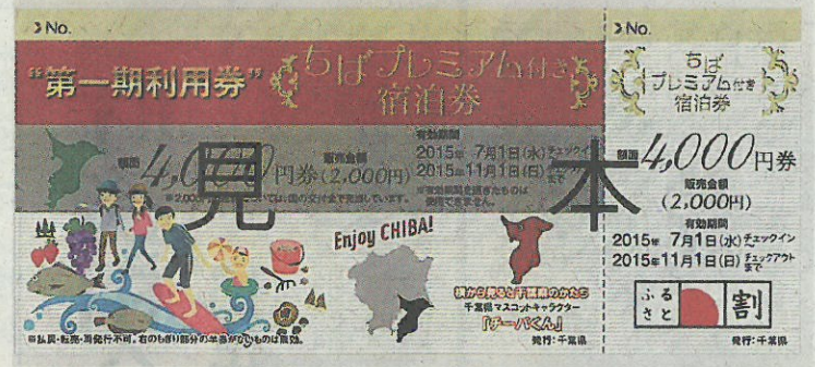
額面の半額で購入できる「ちばプレミアム付き宿泊券」(見本)

同宿泊券は1枚4千円のと市中央区)、午後0時半から(ころを半額の2千円で購入で(午前9時半から整理券配布)きる。利用期間は、きょう発 千枚③セブンイレブンなど売の前半(7月~10月末)と、全国5チェーンの店舗、午後9月1日販売開始の後半(9月2時から。4万9千枚。月~1月末)に分けられる。 宿泊券利用者を対象に、抽選で県の特産品が当たるスタンプリーは道の駅や商業施設など県内約30カ所で行われる(宿泊券の詳しい発売場所やスタンプリーの会場など詳しくは県ホームページで)。プレミアム付き宿泊券は、消費喚起のために政府が創設