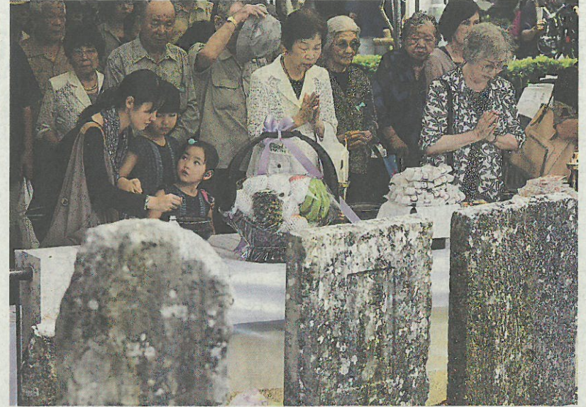
「ひめゆり学徒隊」の慰霊祭で、手を合わせる遺族ら=23日午後、沖縄県糸満市

各地で人気が続いているプレミアム付き宿泊券だが、その割引率の高さから他県では転売も相次ぎ、問題となっている。茨城県では、今日1日に販売したプレミアム付き宿泊券と周遊券が計50枚以上、インターネットオークションに出品されていたことが判明。こうしたケースは各地で起きており、自治体に対応に頭を痛めている。同県の場合、オークションサイト「ヤフオク」で出品を確認。一部はすでに落札されており、担当者は「転売は税金で利益を得ることになり、地方の消費喚起という目的が損なわれる恐れがある」と懸念。ホームページで転売禁止の周知を図るとともに、オークションサイトに取り扱わないよう要請するという。一方、千葉県も転売を禁止するとともに、販売時期を(前・後期)にずらしたり、販売場所を増やすなど正規品を手に入れる機会を増やすことで、転売品の購買意欲が高まらないよう対策を講じている。県の担当者は「転売用に大量購入した場合には売れ残るような仕組みを構築した。転売を規制する法律はないが、なるべく起こらないように対応しなければならぬ」としている。